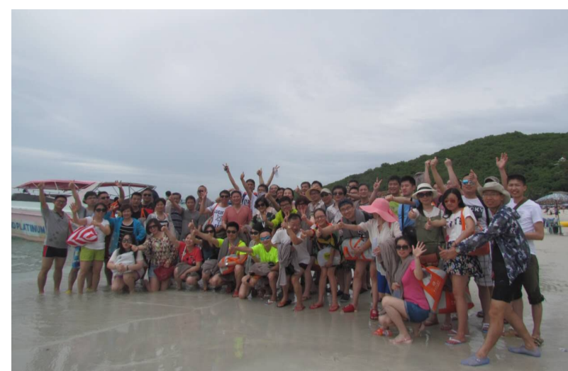
芭提雅“格兰岛”海滩 部分员工合影