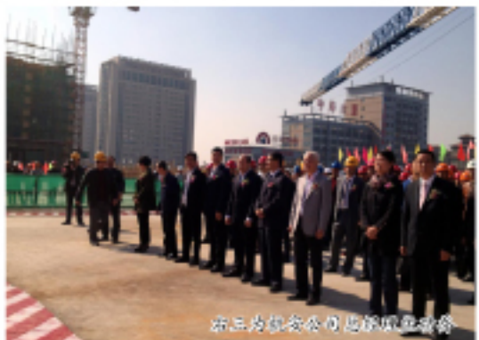
图为杭安公司海宁银泰城项目